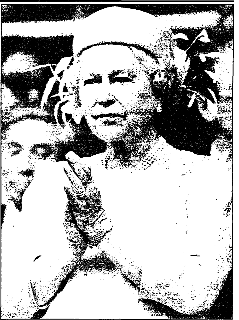
ملكة اليزابيث الثانية

لندن - من اودي وودز: اللورد المستشار، رئيس القضاة البريطاني، سئم من ارتداء بذلة من القرن السابع عشر في خيابه واياه من العمل، وطالب من البرلمان السماح له بارتداء بذلة رسمية وارتداء الشراول والجوارب الحريرية والهداء ذي البكعة في المناسبات الخاصة.